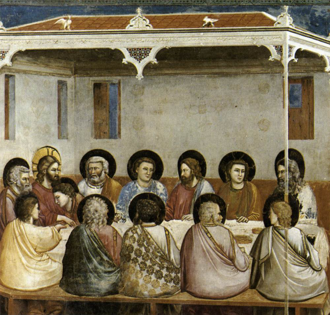
Giotto, Ultima Cena - Capella degli Scrovegni, Padua, Italië

Oud-Katholieke parochie HH. Anna en Maria te Haarlem